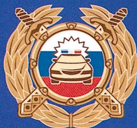
Госавтоинспекция МВД России